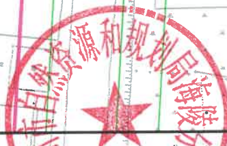
泰州市自然资源和规划局海陵分局红线图 比例:1:1500